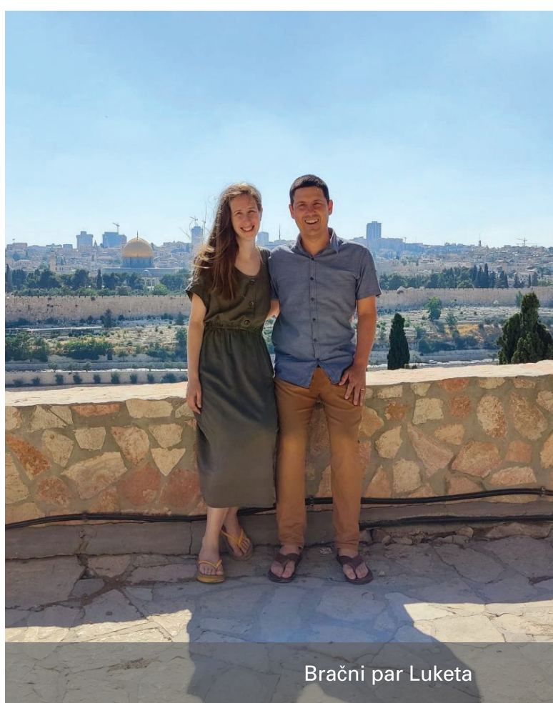
Bračni par Luketa

Ušli smo u brak s odlukom da nećemo povrijediti našu spolnost metodama barijere (kondom, dijafragma i sl.), niti prekinutim snošajem, niti kontracepcijskim sredstvima, već da ćemo pokušati naučiti prirodno planiranje obitelji i njime se ravnati. Na početku braka smo jedno kraće vrijeme odgađali trudnoću, no u toj namjeri nismo bili jako čvrsti, već smo razmišljali da, ako se dogodi trudnoća, radosno ćemo prihvatiti svu djecu koju nam Gospodin želi darovati. Zamišljali smo da ćemo imati više djece u našem braku, ali s određenim pauzama. Nismo mnogo razgovarali o tome, svatko je imao svoju viziju i tako je na tome ostalo.