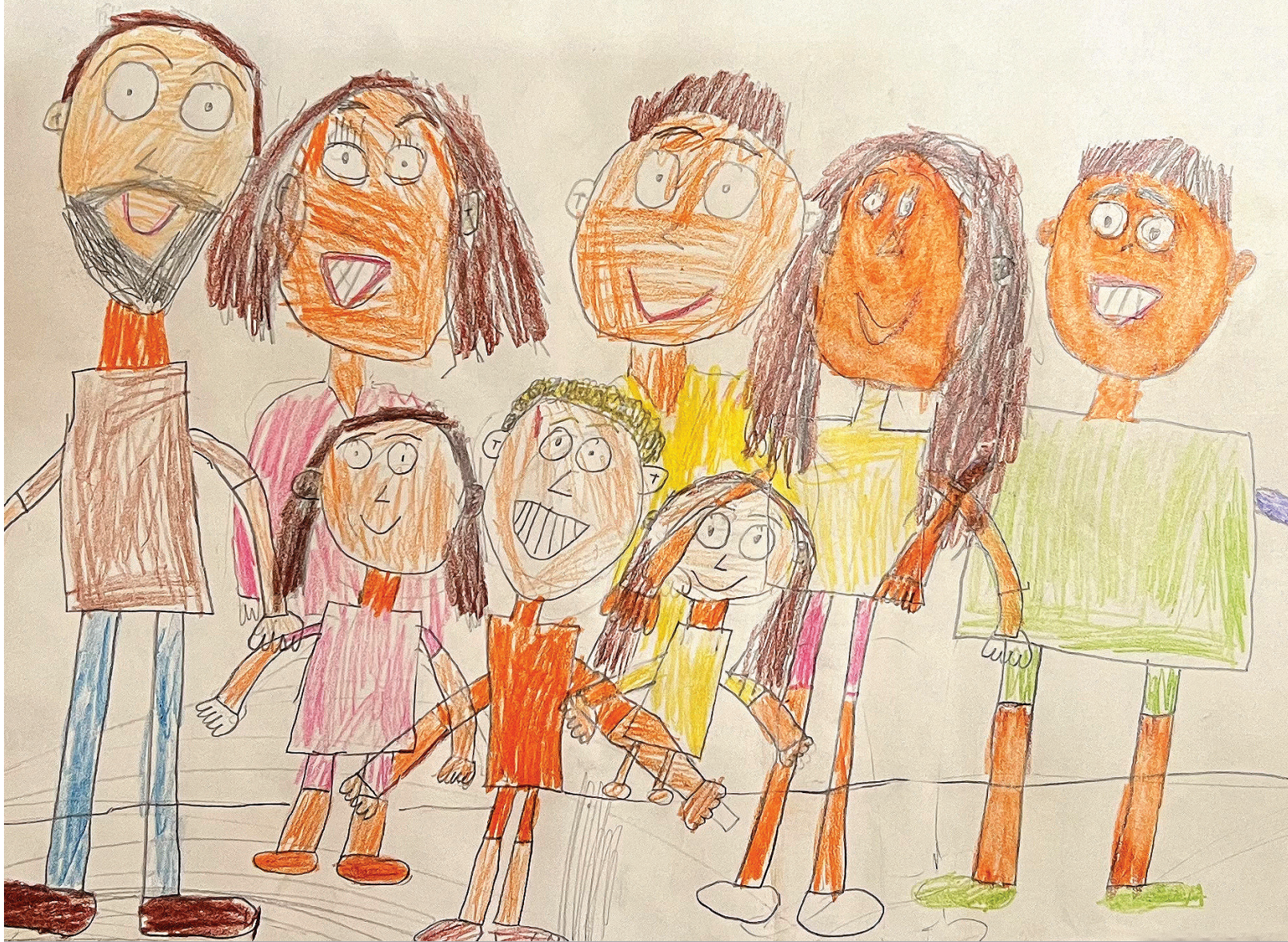
Tomin crtež obitelji

Autizam nas je mnogo naučio o ljubavi, o odgoju, o empatiji, o različitosti, ma mnogo toga nas je naučio.