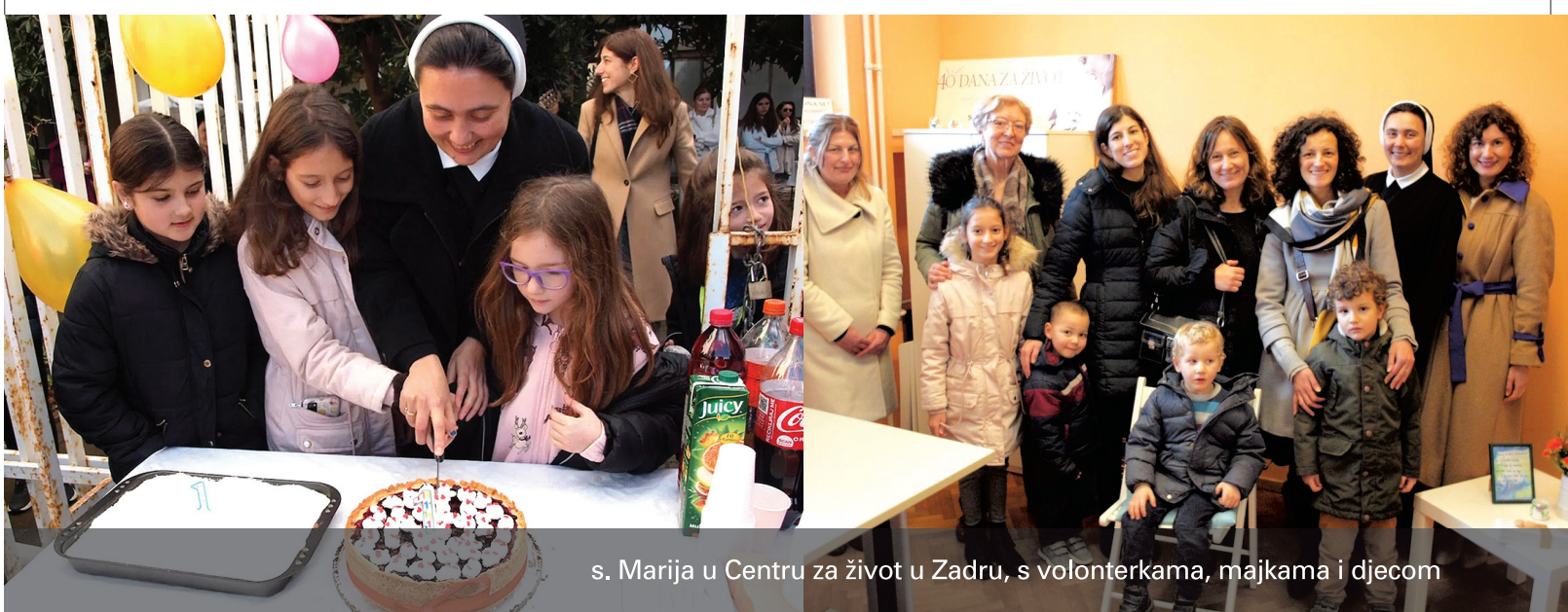
s. Marija u Centru za život u Zadru, s volonterkama, majkama i djecom

Predivno je vidjeti osobe ujedinjene u ljubavi prema nerođenima i njihovim majkama koje mole zajedno i daju sve od sebe da bi pomogle besplatno i bezuvjetno. Gospodin takvim osobama uzvraća stotruko.