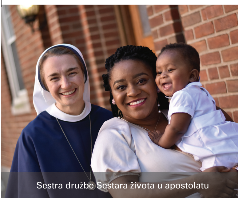
Sestra družbe Sestara života u apostolatu

zagovornika za život. Bog ima potpuno jedinstveni i prekrasan plan ozdravljenja za svaku ženu koja je pretrpjela iskustvo pobačaja. Mnoge žene mogu se osjećati usamljeno i izolirano u svome sramu, boli, tjeskobi i krivnji... Katkad godinama. No posebno u iskustvu kao što je pobačaj, nije nam suđeno da budemo sami. Dakle, kao Sestre života imamo cijelu službu nade i iscjeljenja kako bismo donijele mir i iscjeljenje. Imamo sestre koje su spremne susresti se s bilo kojom ženom, osobno ili preko telefona. Nudimo sigurno, povjerljivo i neosuđujuće okruženje koje može omogućiti ženama da uđu u Isusov iscjeljujući zagrljaj.« No, uz žene, nerijetko im se javljaju i muškarci, najčešće zbog toga što je netko koga poznaju (djevojka, prijateljica, sestra ili slično) u kriznoj trudnoći ili je nedavno pretrpjela iskustvo pobačaja. »Uvijek je moćno prisjetiti se kako odluke o životu i ljubavi utječu na toliko mnogo ljudi«, ističe s. Chiara Madonna.