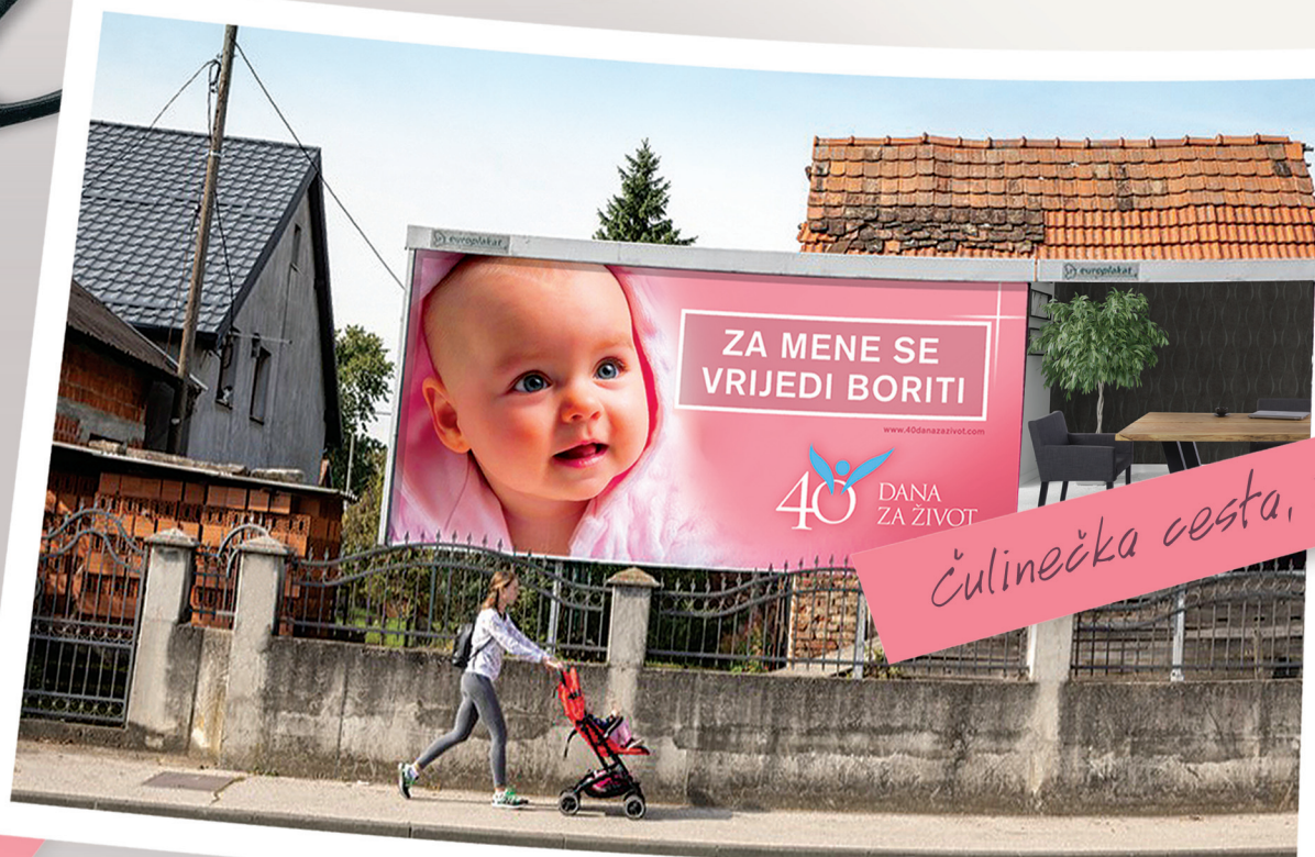
Čulinečka cesta, Zagreb

Ove smo jeseni našu prisutnost na mjestu bdjenja proširili i na pro-life jumbo plakate diljem Lijepa Naše. Jeste li ih igdje uočili?