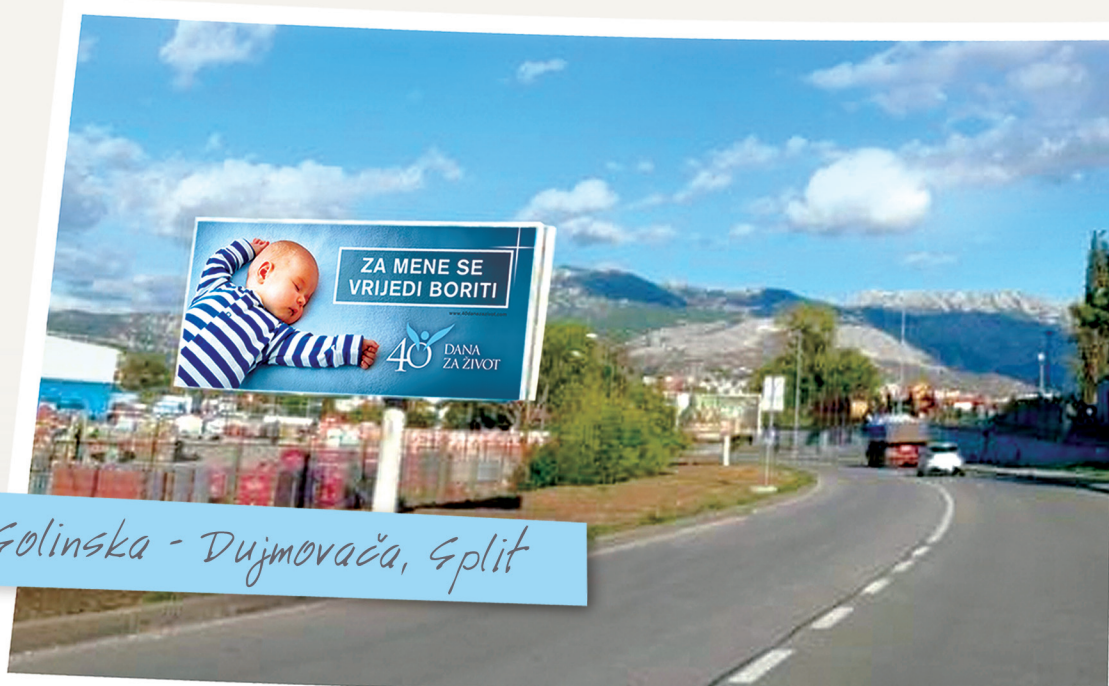
Solinska - Dujmovača, Split